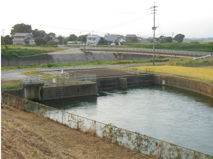
桂川の伏越（逆サイフォン）