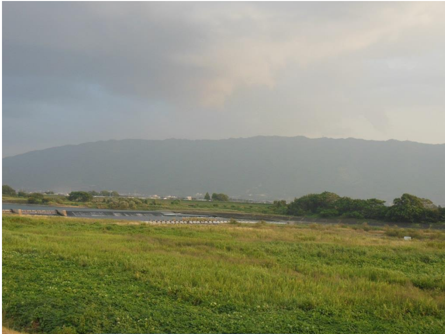
床島堰（筑後川中流）