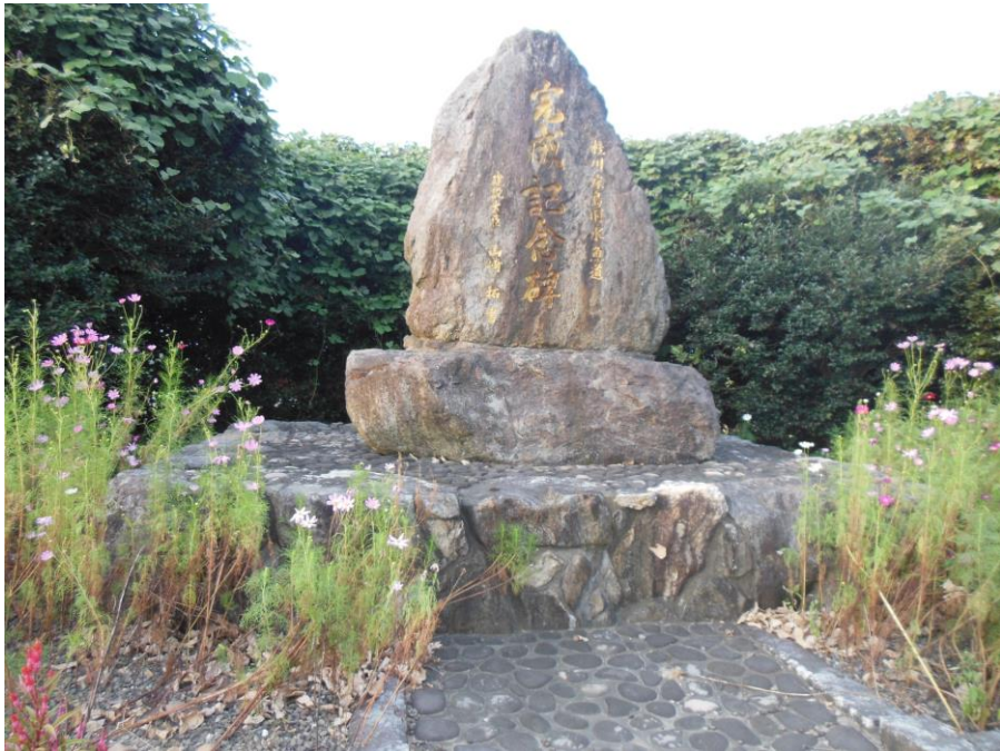
桂川・床島用水 魚道完成記念碑