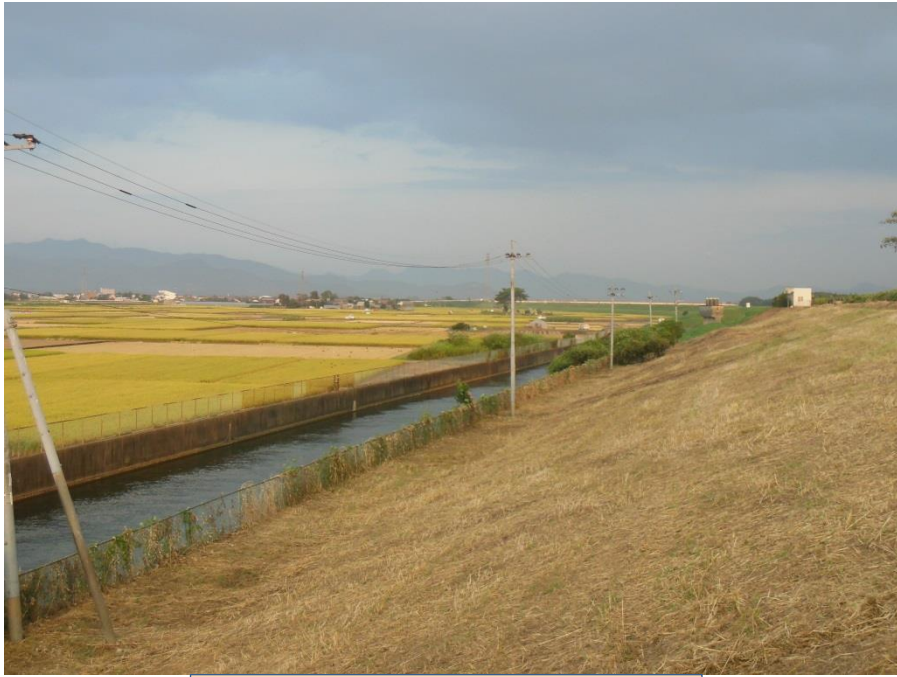
取水後の床島水路（逆サイフオンの上流）