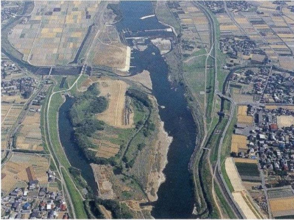
● 恵利堰 全景

恵利堰は筑後川を堰きとめて用水路に導入する基幹施設で、さらに水路には途中で水量調節のための床島堰、水量増加用の佐田堰とが付属しており、通常一括して床島堰とよばれている。床島堰は田主丸町(現・久留米市)、大刀洗町に位置し、朝倉市に隣接する。恵利堰もまた石畳構造になっており、左岸側に近代的な魚道が設置されていて、この堰もまた水景美を誇っている。