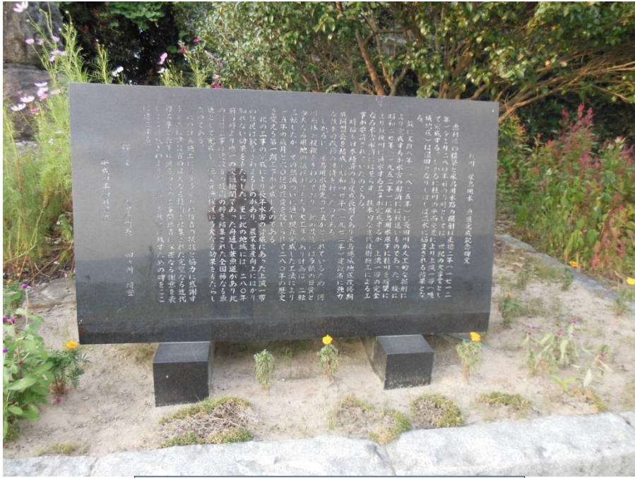
桂川・床島用水 魚道完成記念碑文