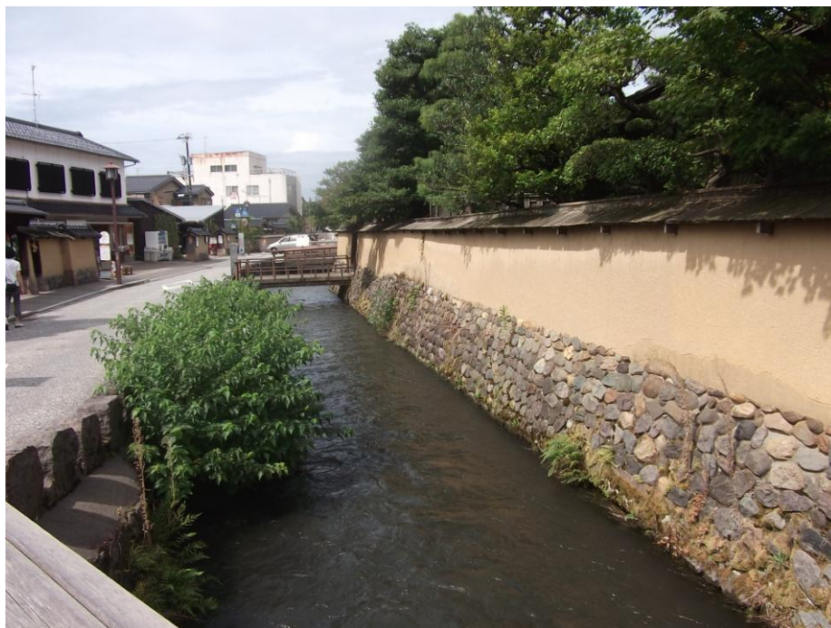
水路の右岸は武家屋敷になっている。